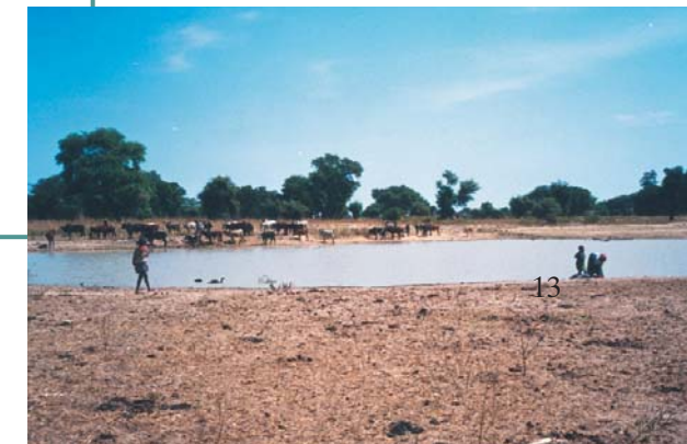
Ἡ λιμνοῦλα γιά ὅλες τίς χρήσεις στήν ἀνομβρία θά ἐξαφανιστεῖ.