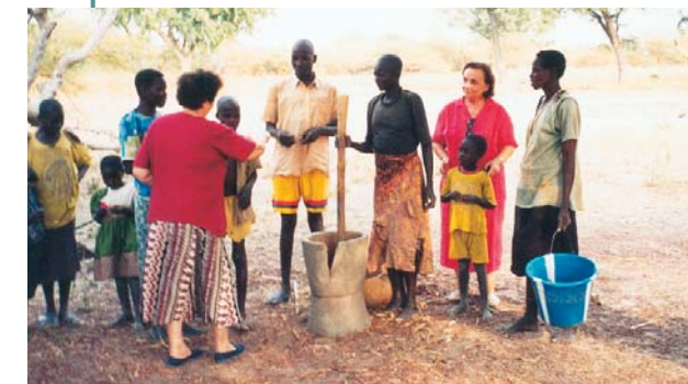
Στό γουδί σπάζουν τό κεχρί.