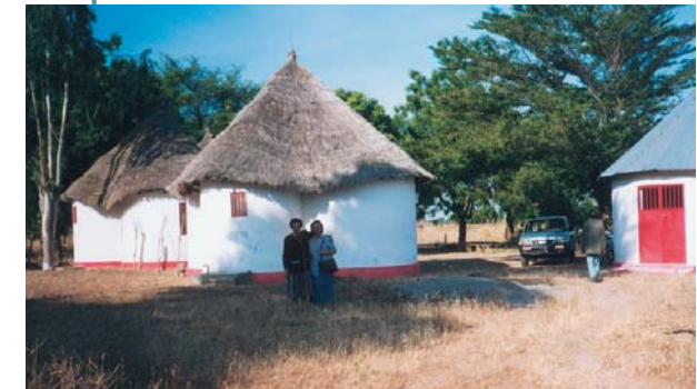
Τό ιεραποστολικό κέντρο τοῦ βορρά κτισμένο κατὰ τόν παραδοσιακό τρόπο μέ σπίτια «μπουκαρού».