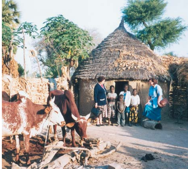
Τό σπίτι «μπουκαρού» μιᾶς οικογένειας στο βόρειο Καμερούν.

Ήταν ἡ δεύτερη φορά πού ἐρχόμασταν στό Καμερούν καί μάλιστα στήν πρωτεύουσά του, τό Γιαουντέ. Μιά πόλη ἀπό τίς καλύτερες, ἴσως, τῆς Ἀφρικῆς. Μεγάλα κτίρια, παλιάτα σύγχρονα τῶν πλουσιῶν, ἀλλά συνάμα καί ἄθλιες τρώγλιες τῶν πτωχῶν. Ἐδῶ βρίσκεται ἡ μητρόπολη τοῦ Καμερούν μέ Μητροπολίτη τόν κ. Δημήτριο. Πρόθεσή μου δέν εἶναι νά περιγράψω τό Γιαουντέ, ἀλλά τό ταξίδι στό βόρειο Καμερούν, τόν βορρά, ὅπως ἀλλοῦς τόν ἀποκαλοῦν οἱ ντόπιοι.